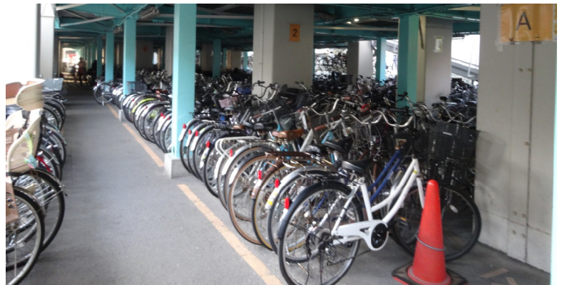
JR本八幡駅高架下の八幡第3駐輪場(無料)満杯です。駅から遠くても無料駐輪場は人気で、入口で並ぶ人がいるほどです。

627万円、使用料収入は4億6401万円である」と述べ、特定の人が利用するので市民負担率は100%の視点で「無料駐輪場有料化の検討が必要だ」と答弁。さらに「鉄道事業者へは高架下の賃借料を低く抑えるよう交渉している」と答弁しました。