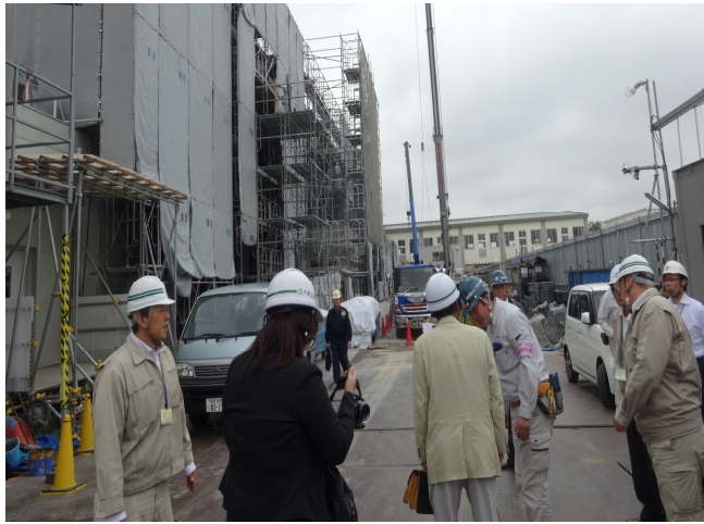
現場で関係者の説明を受ける

そして元請の業者関係者と懇談しました。関係者は懇談の中で「法定福利費を下請けの協力会社が請求してこない」、賃金についても「末端労働者まで把握していない」などの課題を明らかにしました。