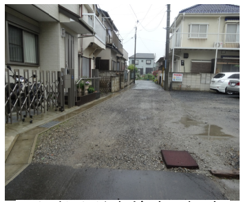
2軒だけが砂利道の私道

市は私道の側溝や舗装整備の支援をしています。曾谷の方から2軒分が未舗装と相談がありました。市に問い合わせると工事費の25%の住民負担で舗装が可能とのこと。舗装は2軒以上が対象で、行き止まりの場合は40%の負担となります。