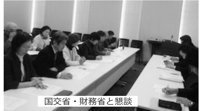
国交省・財務省と懇談