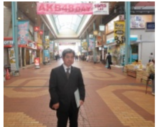
日本一元気な商店街視察 写真は、佐世保市「させぼ四ヶ町商店街」を視察。元気のもと、「人づくり、市民参加のまちづくり」とのこと。 (建設・経済常任委員会で10月17日～19日、長崎県、大村市、佐世保市を視察)

ご意見はもっともです。私たちは線量は少なければ少ないほどよいとの立場で、議会で除染を要求してきました。市議団は現在、市内の公園など線量を測定中、除染マップをつくり市長に要望する予定です。みなさんの地域でも心配な所があればお知らせ下さい。(金子貞作)