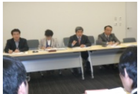
昨年11月、党団委員会と厚労省と交渉写真(私)私は公契約条例制定を国に求めました。

度、19件全て市内業者が受注する改善をした」と述べ、さらに「監督職員制度を導入し、適切な指導が育成に繋がっていく。今後も市内でできるものは市内要件を入れて実施する」と答弁しました。