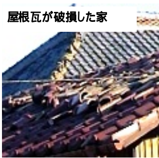
屋根瓦が破損した家

「市から30万円振り込まれました」、瓦が被災し、トタン屋根に換えたことで助成金が受けられた人の声です。市の住宅防災リフォーム助成制度（工事費の2分の1、30万円限度）を受けけるには、災害証明書の発行が必要。工事が完了していても助成されません。詳しいことはご相談下さい。