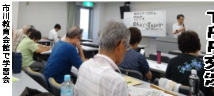
市川教育会館で学習会