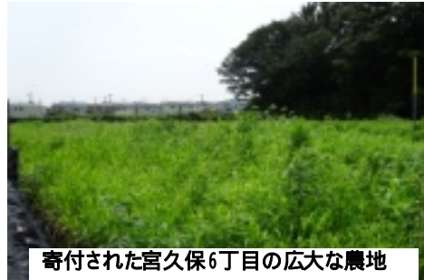
寄付された宮久保6丁目の広大な農地

園が不足している市川市。待機者が年々増え続けています。「特養ホーム待機者ゼロをめざす会」は、外環代替地を活用し、特養と保育園の増設を求める署名が、1万筆を超えました。今後、国会で活用できるように取り上げてもらいます。