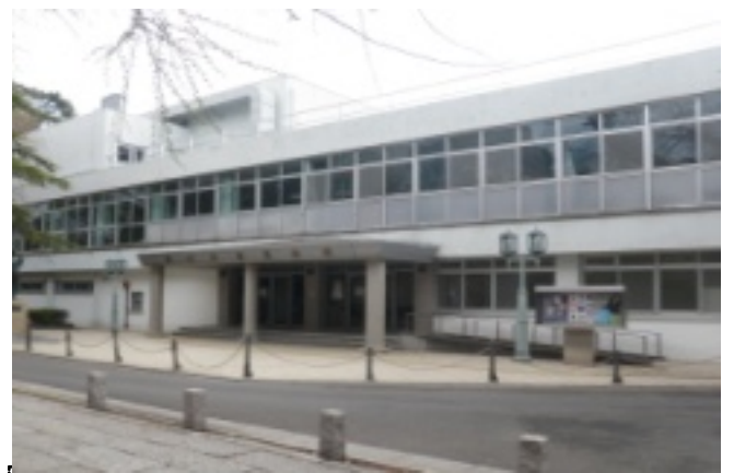
市民会館の吊り天井が崩落する危険性があると、4月からホールの利用を中止しました。調査したところ、天井の裏側に多数の亀裂が見つかり、崩落の危険と判断。今後、建て替えを検討するとしています。（写真は八幡4丁目の市民会館）。

日本共産党は、一貫して安心・安全な街づくりを目指し、耐震助成制度の充実などを求めてきました。 今年度から「あんしん住宅助成制度」が創設され、現在申請を受付中。市内業者の仕事確保、経済活性化にもなる事業です。