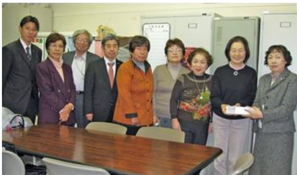
11月22日、市民団体の皆さんと、特養ホームと保育園増設の要望書を福祉部長に提出