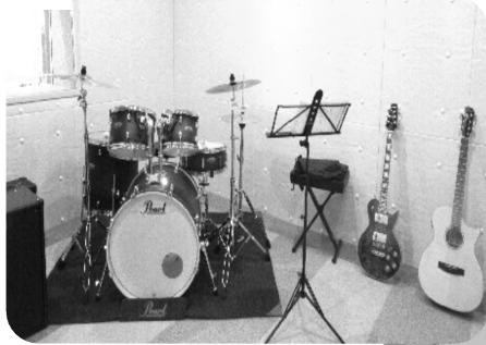
音楽室のドラムフルセット