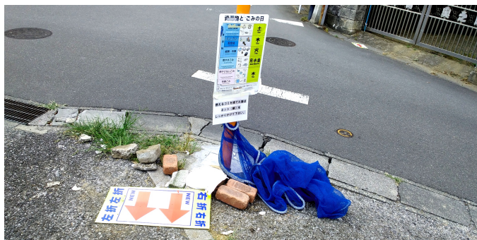
ゴミ集積所の改善を要望