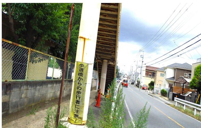
小学校前の歩道橋劣化が不安