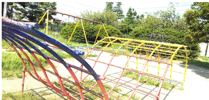
交通公園の遊具のメンテナンスを ペンキが剥げ、サビが目立つ